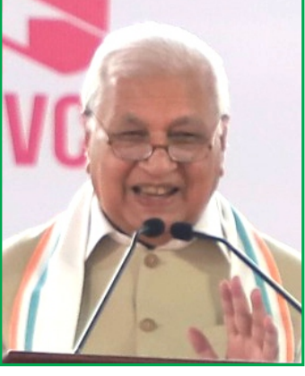
શ્રી આરિફ મોહમ્મદ ખાન માનનીય રાજ્યપાલશ્રી, બિહાર