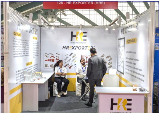
242, Soham Arcade,B/H. Madhav Atria,Green City Road, Pal, Surat, Gujarat India - 395009

Cable Accessories Copper & Aluminum Cable Lug.