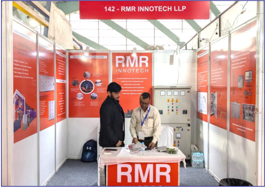
Plot No. 7125, Road No. 71, GIDC, Sachin, Surat, Gujarat, India - 394230

Manufacture of electric motors, generators, transformer and electricity distribution and control appartus.