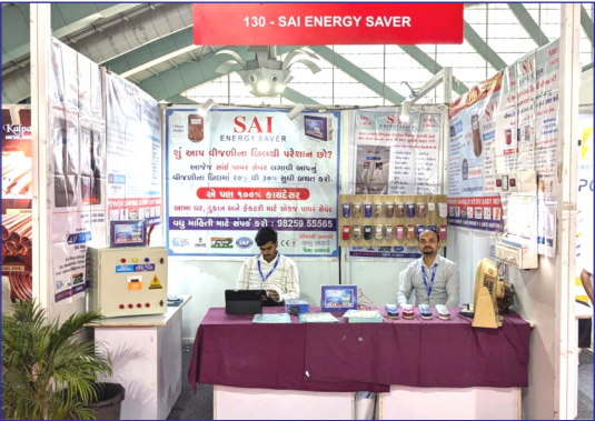
B - 309, Udhna Sangh Complex, Opp. BOB Bank, Udhna , Surat, Gujarat, India - 394210

Save Electricity bill upto 30%. Save Energy, Save Nation, Save Money. Make In India.