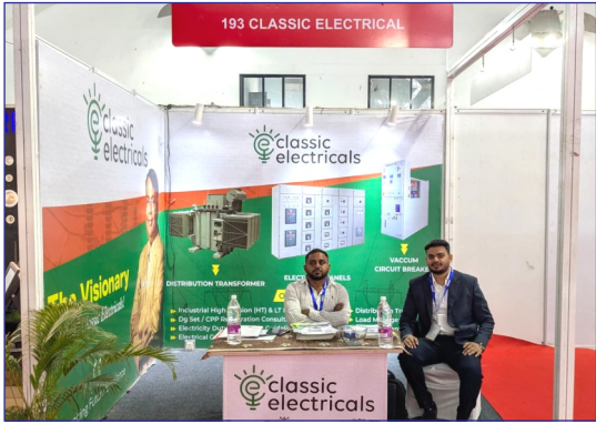
124, 1st Floor, Ambedkar Shopping Center, Mandarwaja, Ring Road, Surat, Gujarat