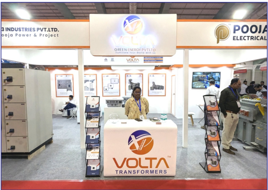
New Block No.103, Plot No. 1, Olypia Street, Mota Borsara,Kim, Surat, Gujarat