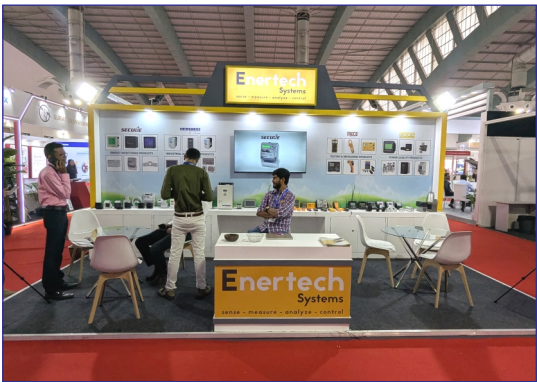
4th Floor, 427, Avadh Kontina, VIP Road, Near C B Patel Club, Vesu, Surat, Gujarat, India - 395007

Electrical testing measuring equipments. Control panels, panel meters, variable frequency drives, multi meters, clamp meters etc.