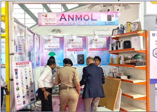
168, Om Sai Nagar, B/h.Hari Nagar -2, Udhna, Surat, Gujarat, India - 394210