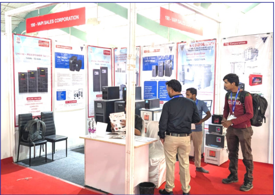
123, VSC House, Ashirwad Township 2, Bamroli Road, Surat, Gujarat, India - 394 210