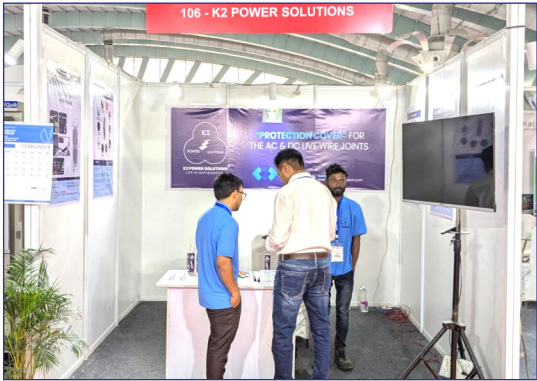
B-1/ 402, Swapna Shrushti Residency, Jiav Budia Road, Nr. Mitali Gas,Bhestan, Surat, Gujarat India - 395005