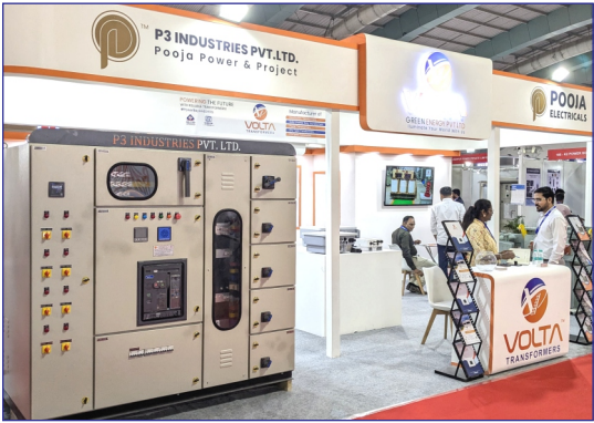
Shop No. 7, J B Row House, Ground Floor, Palod, Kim, Surat, Gujarat, India - 394111

Perphase Electronics, established in 2009, is one of India's leading manufacturers of lighting and solar products. With a strong portfolio of 3500+ indoor, outdoor, and solar lighting solutions.