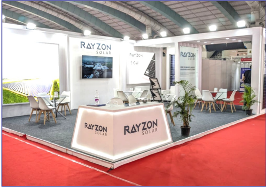
1104-1117, 11th Floor, Millennium Business Hub-1, Opp. Sarsana Nature Park, Varachha , Surat, Gujarat, India - 395006