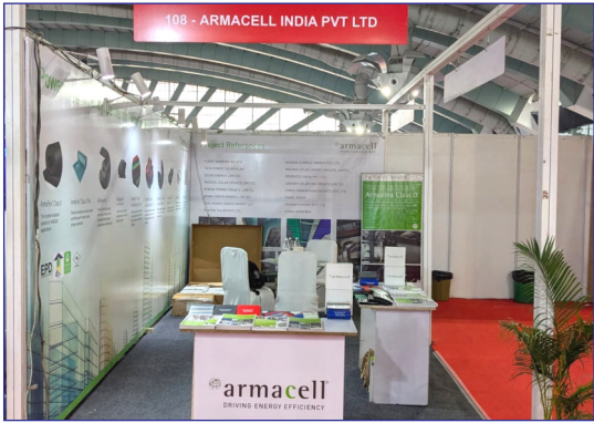
Gat No. 744 & 745, Nagar Road, Lonikand, Pune, Maharashtra, India - 412216