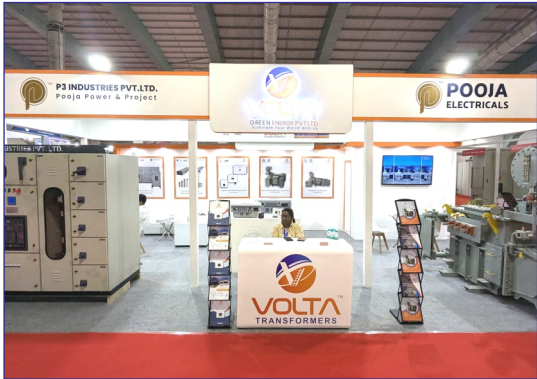
Shop No. 7, J B Row House, Nr. Union Bank, Kim Char Rasta, Surat, Gujarat, India - 394111