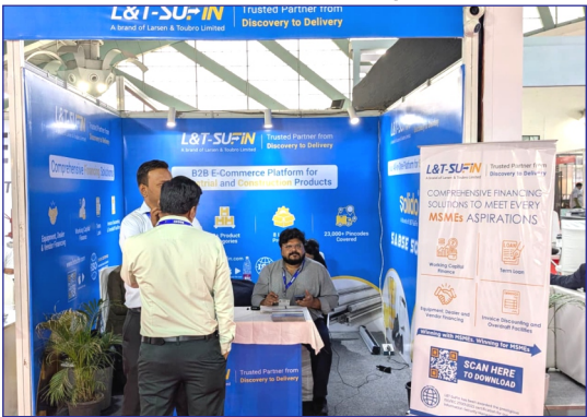
L&T-SuFin, C 26 27, The Metropolitan,Bandra Kurla Complex, Mumbai, Mumbai City, Maharashtra, 400051

L&T-SuFin is an integrated B2B e-commerce platform for industrial and construction products, brought to you by Larsen & Toubro, a name synonymous with trust and engineering excellence. The platform is designed to empower buyers and sellers across India by providing a secure, transparent, and efficient digital marketplace. L&T-SuFin brings together product discovery, financing, logistics, and payment solutions—enabling businesses of all sizes to grow and thrive.