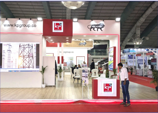
KP House, Nr. KP Circle, Opp. Ishwar Farm BRTS Junction, Bhatar Canal Road, Surat, Gujarat