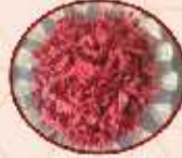
Amla Beet Ginger