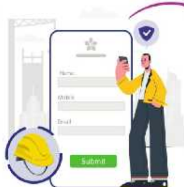
2. Capture visitor details digitally