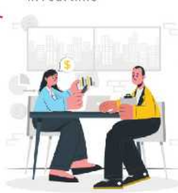
5. Facilitate meetings with scheduled check-ins