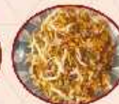
Gujarati Flax Seeds