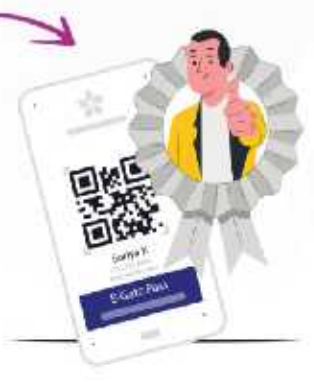
4. Issue secure digital passes for authorized access