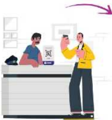
1. Simplify check-ins with a quick QR code scan

Smart Visitor Management for your Business