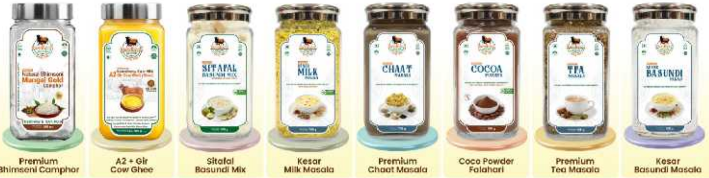
Premium Bhimseni Camphor

GO VEG GO GREEN LIVE HEALTHY LIVE HAPPY™ सात्विक आहार शुद्ध और हवा से स्वस्थ जीवन