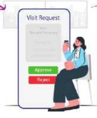
3. Hosts can approve or reject visitor requests in real time