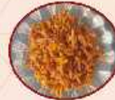
Amla, Amba Ginger, Haldar