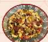
Seeds & Berries